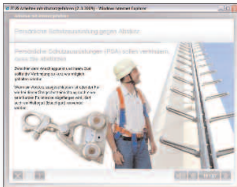
Beispiel: Auszug aus der Unterweisung „Arbeiten bei Absturzgefahr“ – hier Thema PSA

Die Unterweisungs-Module von „Unterweisung interaktiv speziell“ beinhalten Spezialthemen für Großunternehmen und Industrie, wie zum Beispiel: Explosionsschutz, Gabelstapler, Schweißposten/Brandwache und Sicheres Arbeiten im Labor. Eine Unterweisung dauert zirka 15 Minuten pro Teilnehmer.