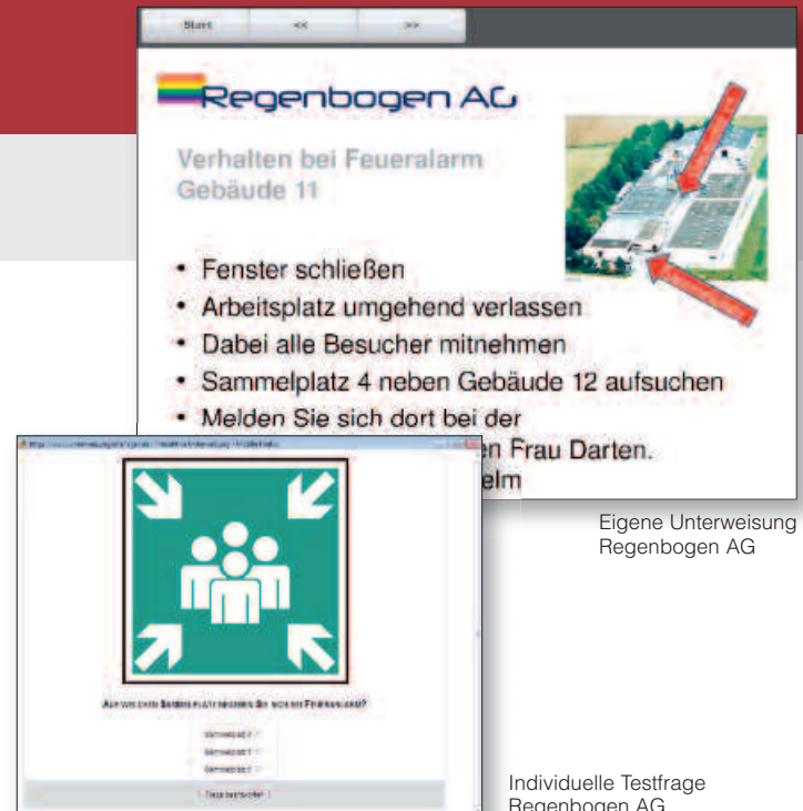
Eigene Unterweisung Regenbogen AG

Zusätzlich muss nach der BGR A1 eine Verständnisprüfung der unterwiesenen Inhalte möglich sein. Mit dem Testfragen-Editor können Sie zu Ihren eigenen Unterweisungen abschließend einen individuellen Fragebogen erstellen.