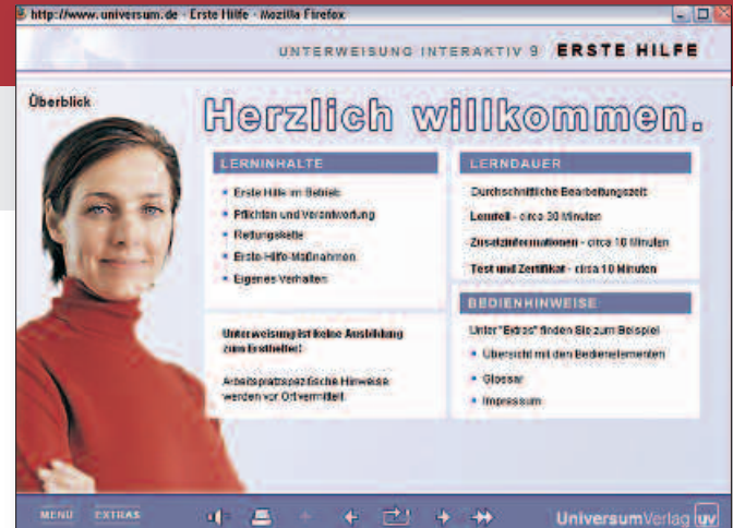
Beispiel: Startseite Unterweisung interaktiv – Erste Hilfe

Alle Module zu den verschiedenen Grundthemen können Sie unter www.unterweisungs-manager.de kostenlos online testen.